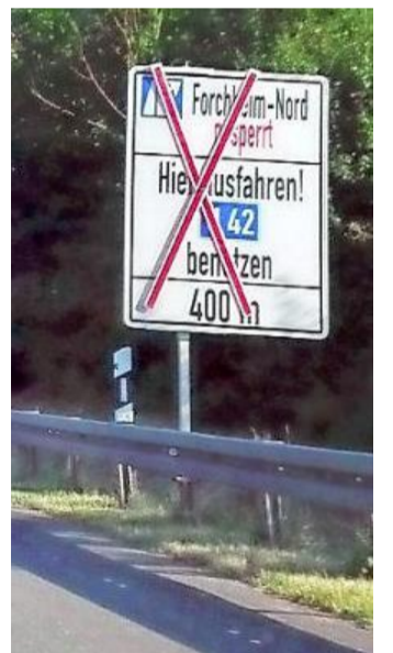
Die Sperrung kündigt sich auf der A 73 vor Hirschaid in Richtung Süden bereits an.

Die Ein- und Ausfahrten der A 73 in Richtung Bamberg sind von der Sperrung nicht betroffen.