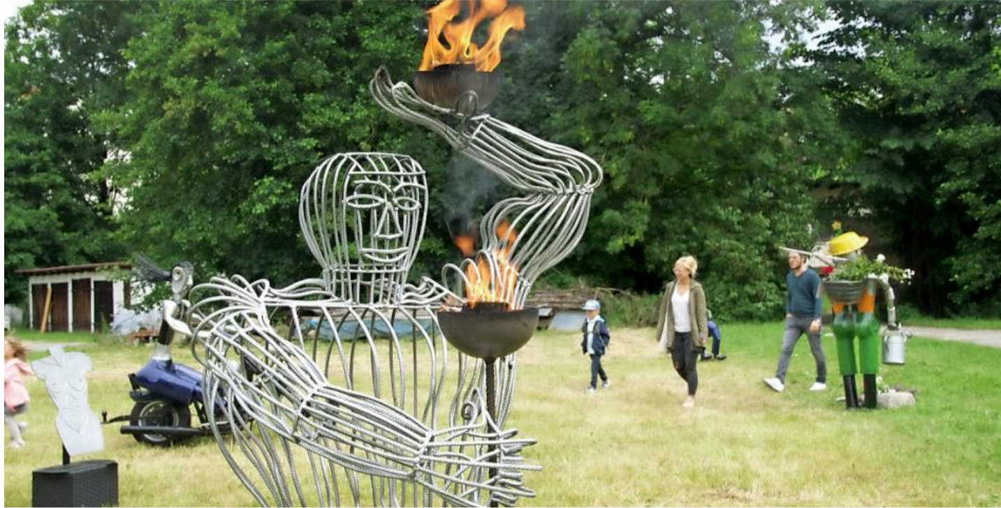
Bei der Kunst- und Kulturmeile in Litzendorf ging es auch schon mal heiß her.